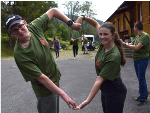
UCZESTNICY I ASYSTENCI PODCZAS LETNIEGO OBOZU W RYCERCIE GÓRNEJ

Wspólnota Spotkań dla dzieci spotykała się w przedszkolu Sióstr de Notre Dame w Brynowie w pierwszym semestrze. Zajęcia organizowali razem rodzice dzieci oraz młodzi asystenci, głównie studenci i młodzież licealna. Grupa ma świetną lokalizację tuż przy lesie i często wybiera się na przyrodniczy spacer. Dzieci chętnie bawią się także na placu zabaw czy w basenie kulkowym. Asystenci prowadzą zajęcia integracyjne. Przykładowe zajęcia, które się odbyły to: jesienne wyklejanki, pieczenie pierników. Działalność grupy zawiesiliśmy po wakacjach z uwagi m.in. na niską frekwencję, małą ilość asystentów.