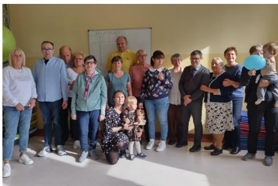
WSPÓLNOTA SPOTKAŃ SPES

Kontynuowaliśmy prowadzenie Wspólnot Spotkań przez cały rok. Osoby z niepełnosprawnością oraz wolontariusze spotykali się w ramach Klubu Integracyjnego Wspólnoty Spotkań dla dzieci oraz Wspólnoty Spotkań dla dorosłych.