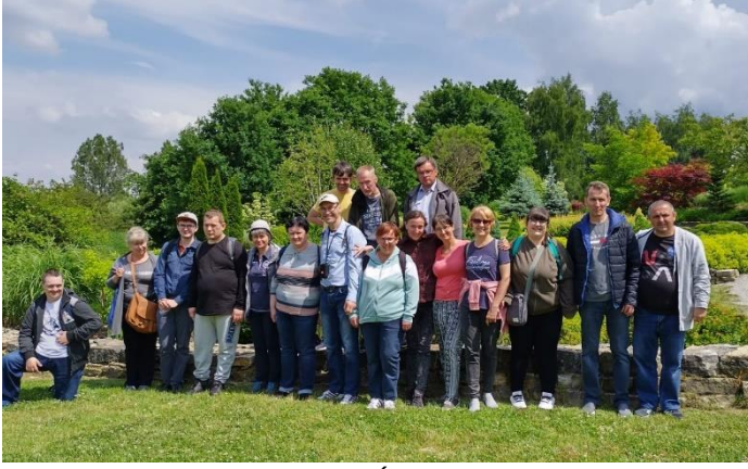
KLUBOWICZE PODCZAS WYCIEZKI DO ŚLĄSKIEGO OGRODU BOTANICZNEGO

Klub integracyjny kontynuował organizowanie wycieczek. Zasadniczym celem była integracja. Uczestnicy spędzali czas z pełnosprawnymi asystentami. Zdobywali wiedzę z różnych tematów, poszerzali horyzonty i nabierali obycia społecznego, np. poprzez trening zachowania się w kinie, restauracji czy w autobusie. W ramach klubu udało się zrealizować: wyjście do kina; wyjazd do Knuruwa na ognisko i sprzątanie lasu; wizytę w Ważnym Miejscu, gdzie uczestniczyli odbyli spacer w